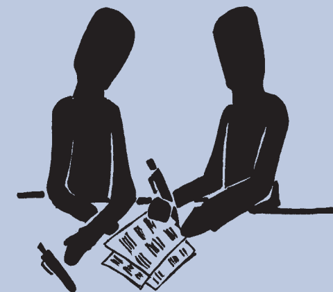
Illustration: Marcus Troeder

Öffentliche Aufträge Mit der Auftragsberatungsstelle zum Erfolg