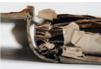
Lose Lagen und zerfallende Papier- ränder an „Deutsche Handels- und Zoll- geschäfte“ (1840er)