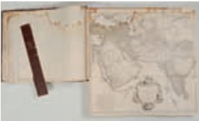
Wasserränder und gelöster Rücken am Atlas Klefeker aus dem 18. Jahrhundert

Der Restaurierung unserer wertvollen Bücher widmen wir uns seit vielen Jahrzehnten. Die Buchpflege und -erhaltung ist für eine Bibliothek arbeits- und kostenintensiv. Die Commerzbibliothek freut sich, dass die Stiftung Hanseatisches Wirtschaftsarchiv und der Förderverein für Hamburgische Wirtschaftsgeschichte die Rettung der historischen Bücher unterstützen wollen. Gemeinsam suchen wir Jubiläums-Buchpaten, die uns bei dieser wichtigen Aufgabe helfen. Dafür haben wir ganz besondere Buch-Schätze ausgewählt. Wir freuen uns über Ihr Interesse und das Engagement bei der Rettung dieser Bücher.