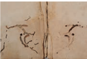
Durch die „Anmerkun- gen zur Hamburger Gerichtsordnung“ von 1692 hat sich ein Holzwurm gefressen