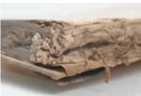
An Cramers „Denkwürdiges aus dem Leben der Aurora von Königsmark“ von 1836 haben sich Mäuse versucht