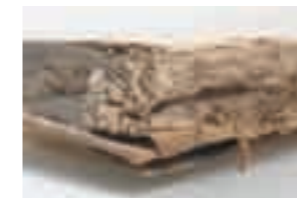
An Cramers „Denkwürdiges aus dem Leben der Aurora von Königsmark“ von 1836 haben sich Mäuse versucht