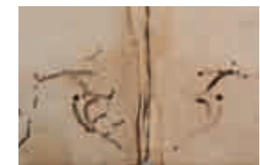
Durch die „Anmerkungen zur Hamburger Gerichtsordnung“ von 1692 hat sich ein Holzwurm gefressen