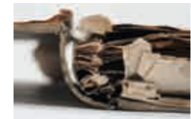
Lose Lagen und zerfallende Papierblätter an „Deutsche Handels- und Zollgeschäfte“ (1840er)