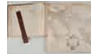
Wasserränder und gelöster Rücken am Atlas Klefeker aus dem 18. Jahrhundert

Der Restaurierung unserer wertvollen Bücher widmen wir uns seit vielen Jahrzehnten. Die Buchpflege und -erhaltung ist für eine Bibliothek arbeits- und kostenintensiv. Die Commerzbibliothek freut sich, dass die Stiftung Hanseatisches Wirtschaftsarchiv und der Förderverein für Hamburgische Wirtschaftsgeschichte die Rettung der historischen Bücher unterstützen wollen. Gemeinsam suchen wir Jubiläums-Buchpaten, die uns bei dieser wichtigen Aufgabe helfen. Dafür haben wir ganz besondere Buch-Schätze ausgewählt. Wir freuen uns über Ihr Interesse und das Engagement bei der Rettung dieser Bücher.